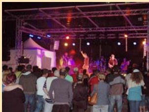
FESTI FOX : Le premier festival de musiques acoustiques, organisé au Jardin de Ville les 26 et 27 juin, a réuni une pléiade de jeunes artistes au talent fou. Comme dirait le renard, waouhh !!! Une belle réussite.