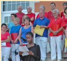
HOMMAGE A PAUL ELUARD : Lecture du poème "Liberté" par une jeune vulpillienne le 13 juillet.