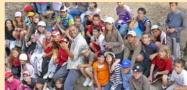
SORTIE SCOLAIRE : Les élèves de CM2 de l'école des Marronniers se sont rendus à Lus-La-Croix-Haute (Drôme) pour leur sortie de fin d'année.