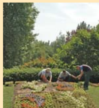
LE BLASON EN FLEURS AU JARDIN DE VILLE.