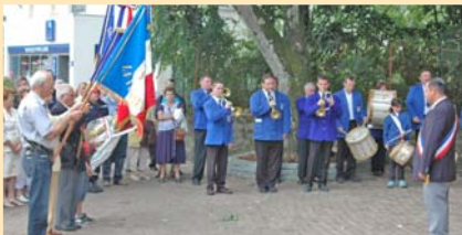
COMMEMORATION : Le 18 juin, la municipalité et les associations d'anciens combattants ont une nouvelle fois honoré la mémoire du Général de Gaulle.