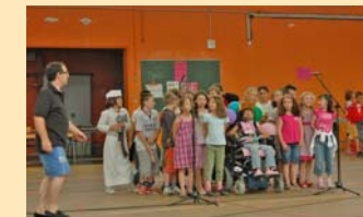
KERMESSES : Fin juin, les groupes scolaires des Marronniers et de Jean Moulin ont célébré comme il se doit la fin de l'année scolaire. Au programme des kermesses : jeux, spectacles et restauration sur place.