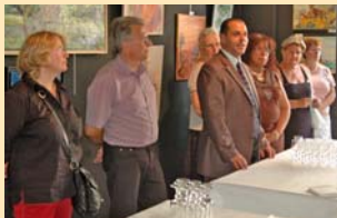
VERNISSAGE DE L'EXPOSITION "ARTISTES DE LA VERPILLIERE": Fenêtre sur cour pour cette exposition qui a permis de découvrir de multiples talents.