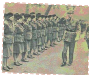
A Londres, le général de Gaulle passe en revue le Corps des volontaires françaises

subit le même sort. Durant cette année, elle arrive à se consacrer à sa thèse sur les Aurès. Mais en octobre 1943, elle est déportée à Ravensbrück. Survivre dans cet enfer sera une bataille de toutes les minutes et Germaine y parviendra grâce à la solidarité et à l'étude. Extraordinaire femme qui, malgré les conditions inhumaines, en ethnologue, étudie minutieusement et reconstitue toute l'organisation, le fonctionnement du camp, l'horreur des expériences pratiquées sur certaines jeunes femmes. Elle devra surmonter la pire des épreuves. Les notes prises à Ravensbrück sont un saisissant et douloureux témoignage de la barbarie mais une source là encore de connaissance inestimable de l'univers concentrationnaire. Sa mère, elle aussi déportée à Ravensbrück, sera gazée un mois avant la libération du camp.