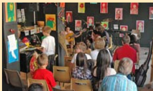
ECOUTE ET MUSIQUE : Les auditions proposées par l'Ecole de Musique tout au long de l'année ont permis aux familles de voir les progrès accomplis tout au long de l'année.