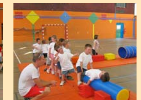
BABY GYM : La démonstration annuelle de la baby gym a eu, une fois encore, un succès fou. Entre souplesse et agilité, les enfants se sont bien amusés.