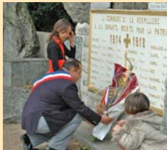
... Et un devoir de mémoire pour nos libertés.