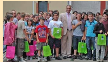
LE COMPTE EST BON : Fin juin, les 68 élèves de CM2 des trois groupes scolaires ont été récompensés par la municipalité pour leurs bons résultats scolaires. A l'occasion de leur prochain passage en 6 ème , ils ont chacun reçu une calculatrice pour collégiens. Bonnes vacances !