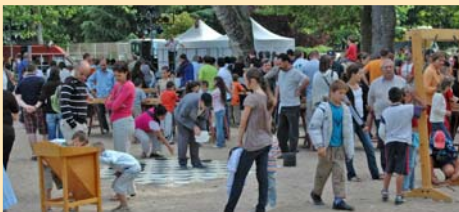
FETE DE L'ETE ET DE LA MUSIQUE : Grande affluence pour cette fête conviviale qui s'est déroulée au Jardin de Ville le 21 juin dernier.