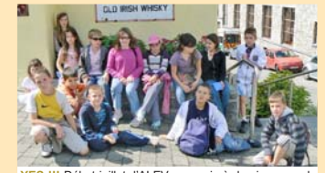
YES !!! Début juillet, l'ALEV a permis à des jeunes vulpiens de mettre en pratique les cours d'anglais appris tout au long de l'année grâce à un séjour immersion en Irlande.