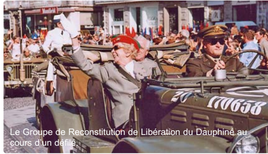
Le Groupe de Reconstitution de Libération du Dauphiné au cours d'un défilé.