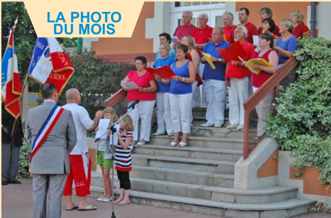
INAUGURATION DE LA DEVISE DE LA REPUBLIQUE INSCRITE SUR LE FRONTON DE L'HOTEL DE VILLE : Liberté, Egalité, Fraternité. Une soirée symbolique avec l'interprétation par la chorale La Coda de la chanson "Liberté" de Nabucco de Verdi.