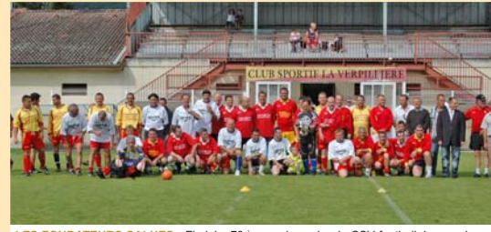
LES FONDATEURS SALUES : Fin juin, 70 ème anniversaire du CSV football. Les anciens et actuels membres du club se sont retrouvés sur le terrain le temps d'une journée.

Rue du Stade Tél. : 04 74 82 77 89 Depuis le 2 mai et pour les mois de juin, septembre et octobre (dimanche 25 octo- bre inclus), la piscine est ouverte : - Lundi de 12h à 13h45 et de 17h à 19h30 - Mardi de 12h à 13h45 et de 16h30 à 19h30 - Mercredi de 14h à 19h - Jeudi de 12h à 13h45 - Vendredi de 12h à 19h30 - Samedi et dimanche de 14h à 19h Juillet & août : du mercredi au dimanche de 11h à 14h et de 15h à 19h.