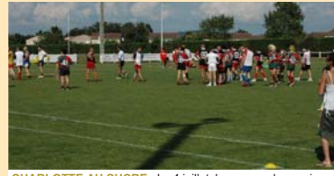
CHARLOTTE AU SUCRE : Le 4 juillet, beaucoup de passionnés de rugby sont venus soutenir l'association "Charlotte au sucre" et participer à un tournoi amical. Quand solidarité rime avec sportivité !