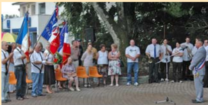
COMMEMORATION TOUJOURS : Le 14 juillet, hommage à la République...