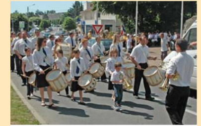
Fanfare Vulpienne : Mi juin, pour son 60 ème anniversaire, la Fanfare Vulpienne a proposé au public un programme musical exceptionnel avec en clôture, un défilé dans les rues de la Ville. Une Marseillaise et 6 fanfares.