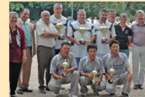
NATIONAL DE PETANQUE : Une belle réussite, et pourquoi pas un international. Ici, les champions de l'Isère partagent l'affiche avec les champions de Thaïlande.