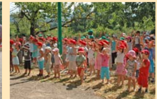
CENTRE DE LOISIRS 3/10 ANS : VIVE LES VACANCES !!! Les enfants tiennent le rythme.